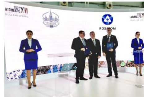
Тематические соглашения о сотрудничестве с регионами и научными институтами