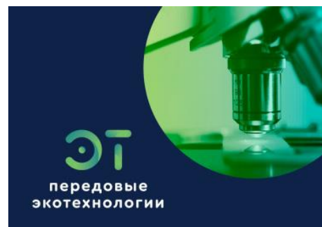
Создание консорциума ведущих вузов и научных организаций