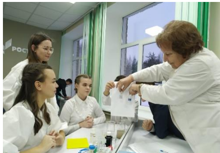
Образовательные проекты для школьников территорий реализации проектов («Менделеевские классы»)

ФЕДЕРАЛЬНЫЙ ЭКОЛОГИЧЕСКИЙ ОПЕРАТОР РОСАТОМ