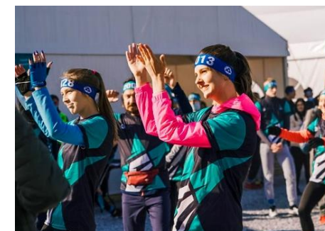
Спортивные праздники на территории рекультивированных объектов