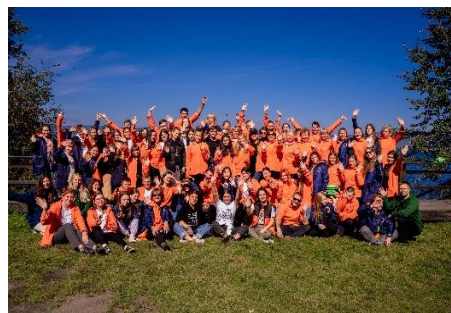
Исследовательские экспедиции для школьников территорий реализации проектов («Менделеевская экологическая экспедиция»)