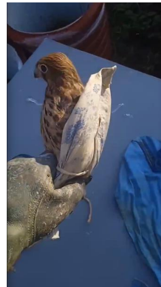
Пример использования фиксирующей пелёнки