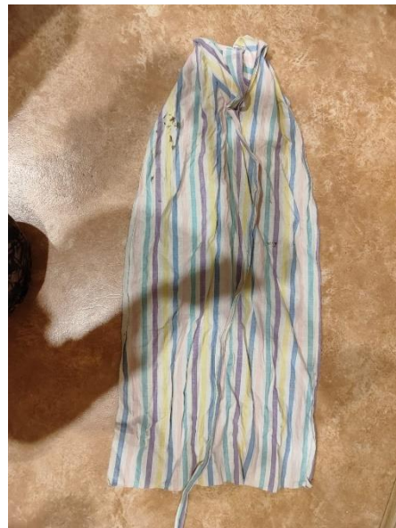
Фиксирующая «пелёнка» для крыльев хищных птиц