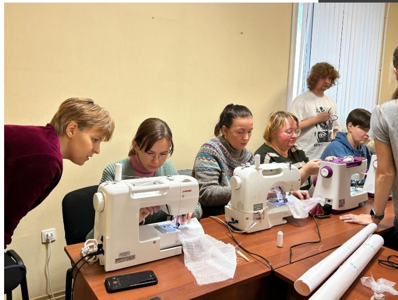
Мастер-класс по пошиву экомешочков