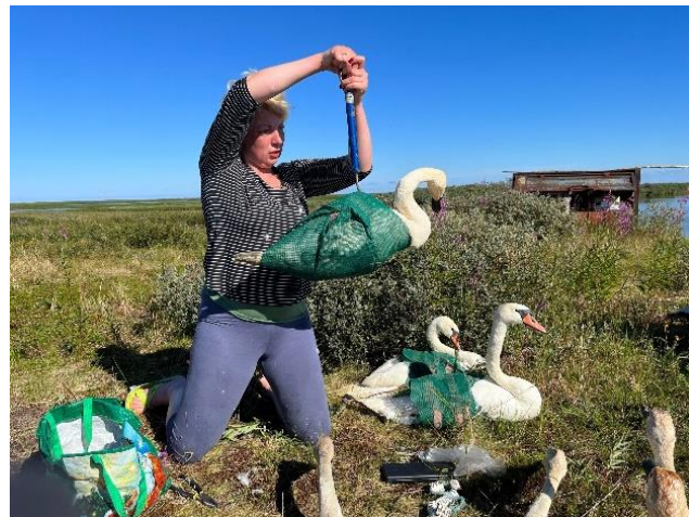
Использование «рубашки» для лебедей Ненецкий заповедник