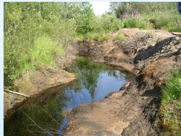
Район смыва нефтезагрязнения в Кузнецов ручей с берега