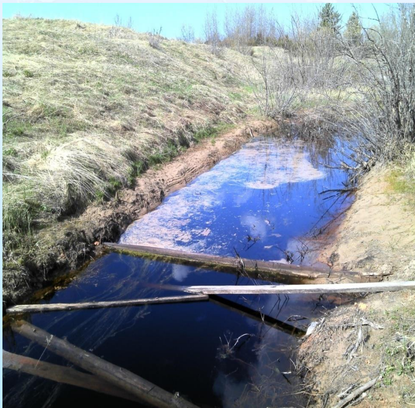
Один из нефтеудерживающих барьеров, установленных поперек течения Кузнецова ручья