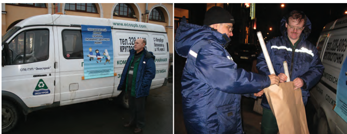
Figure 15,16 Mobile collecting point at work (2008)

и автотранспорт, удовлетворяющий всем требованиям безопасной перевозки отходов (особенно I-III класса опасности).