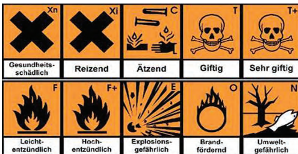
Figure 11 Problem substance tags (from left to right, top to bottom): harmful, irritant, corrosive, toxic, highly toxic, flammable, highly flammable, explosive, oxidizing, dangerous to the environment