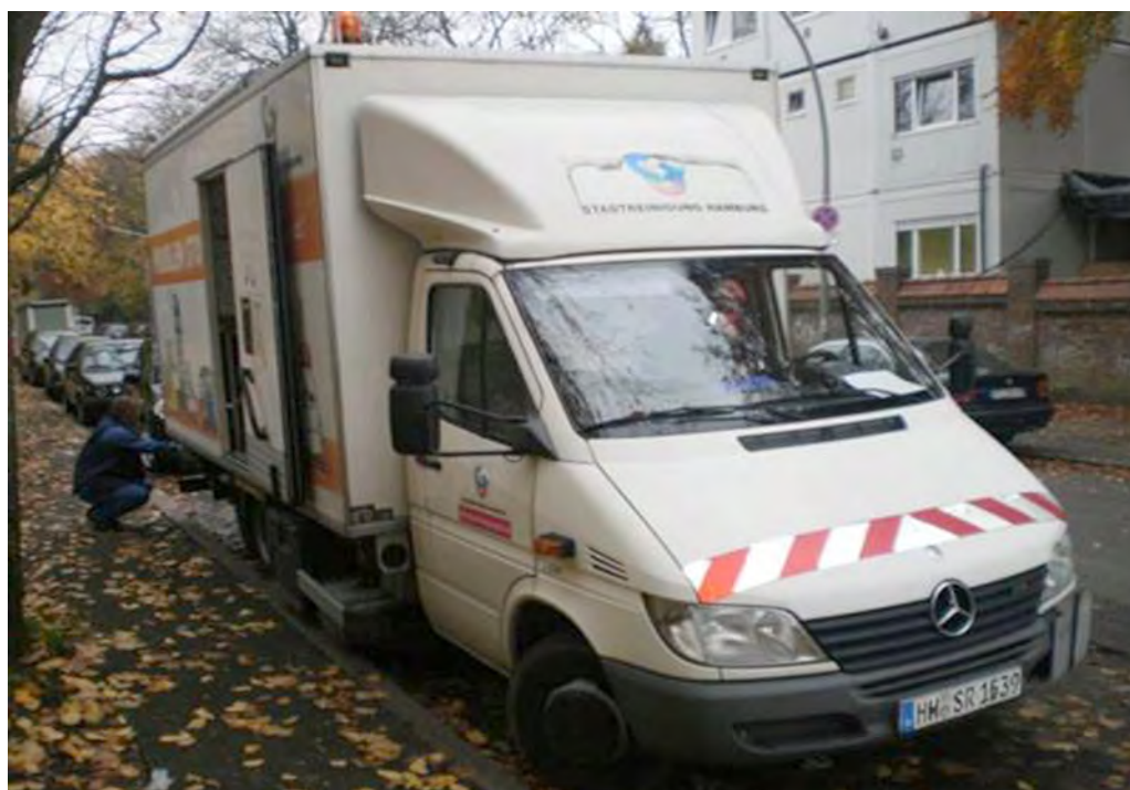
Figure 3 A vehicle for hazardous waste collection at work