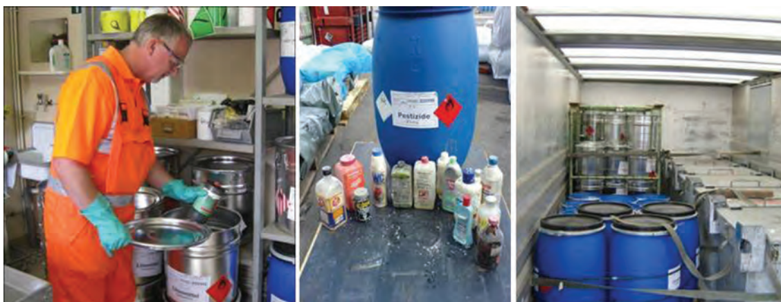
Figure 8,9,10 Collection, sorting and storage of the dangerous goods within the vehicle

требования к упаковке и сортировке подобных отходов.