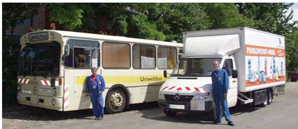
Figure 4 "Eco-bus" (left) and the vehicle for hazardous waste collection today (right)