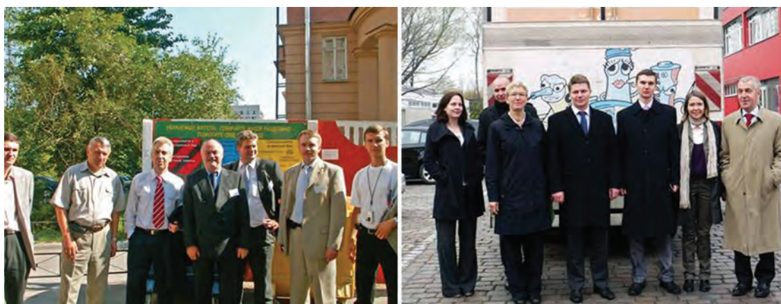
Figure 1,2 Bilateral visits within the framework of cooperation. Left: Delegation of "Stadtreinigung Hamburg" in St. Petersburg (2006). Right: Delegation of the Committee in Hamburg (2010)