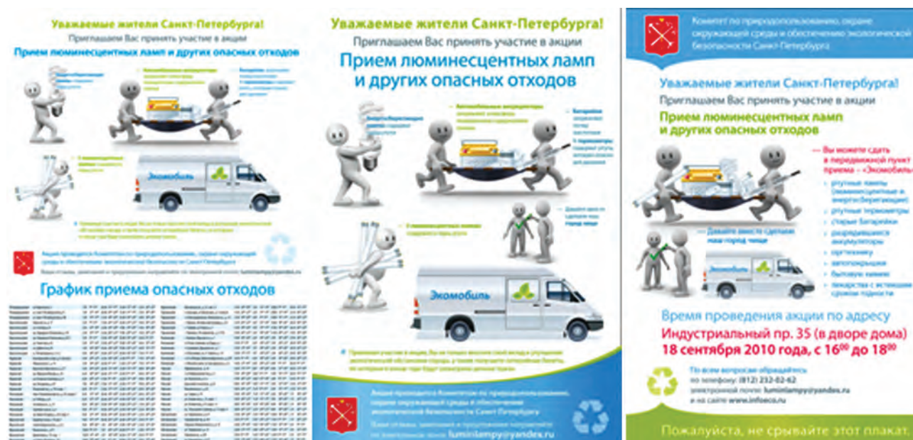
Figures 20, 21, 22 Posters and flyers for awareness raising and information on the regular collection of the hazardous waste by a mobile collection point "Ecomobile"