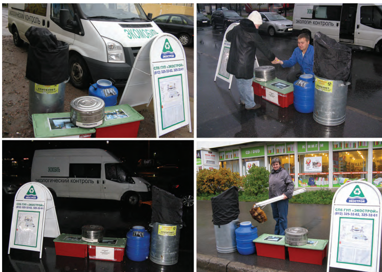
Figures 28-31 Collection of hazardous waste from the households