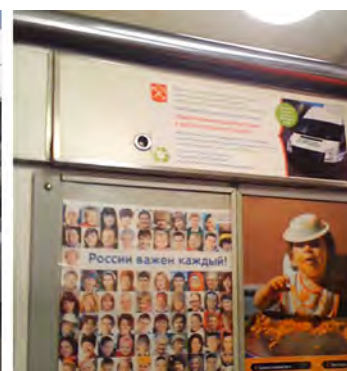
Figures 26, 27 Stickers placed in the trains of the metro