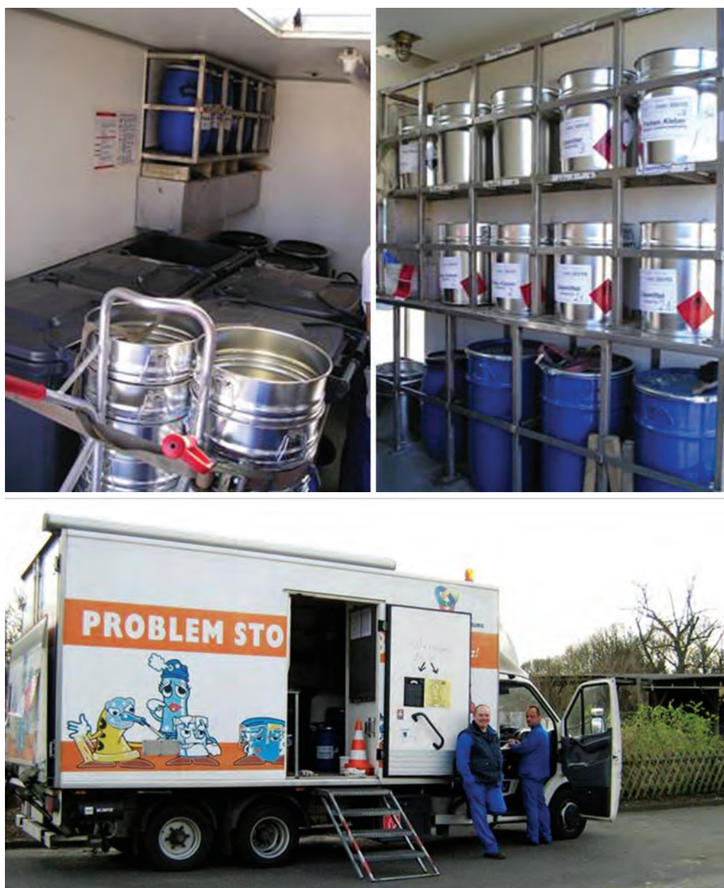
Figure 5,6,7 Vehicle for hazardous waste collection