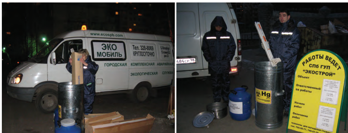
Figure 18, 19 Operation of the “Ecomobile” in 2009