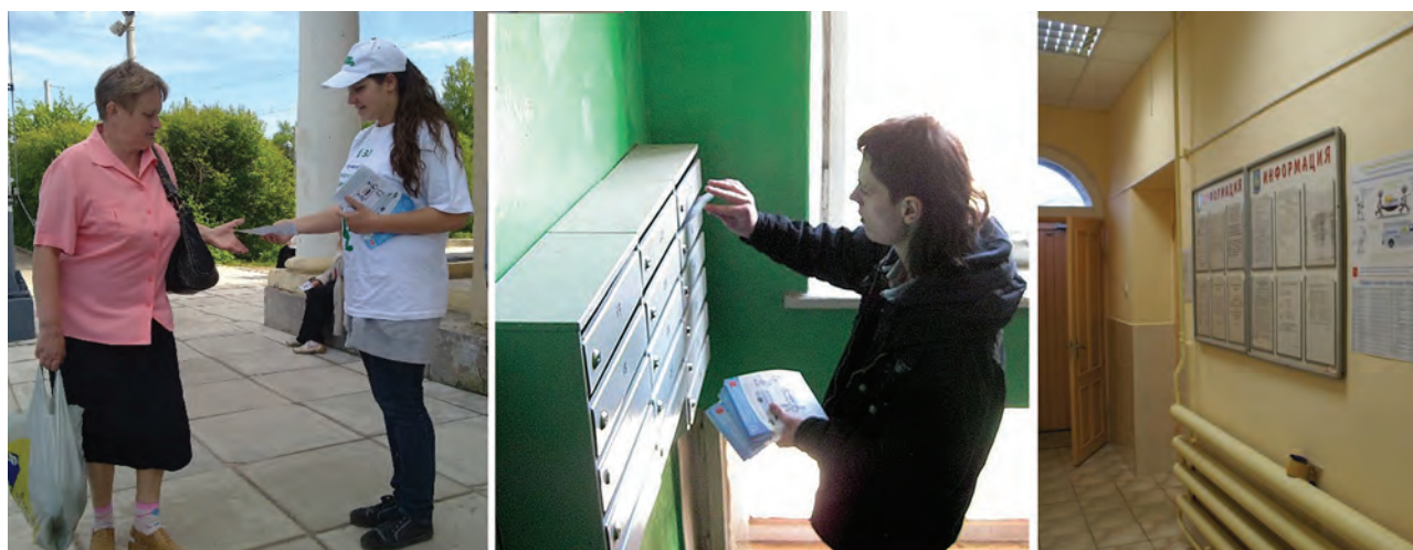
Figures 23, 24, 25 Distribution of information materials: distribution of flyers outdoors, to the mail boxes, posting of banners