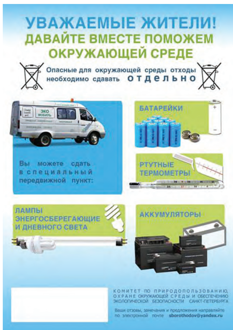
Figure 17 Design of the poster and the flyer

по охране труда на рабочем месте и стажировку.