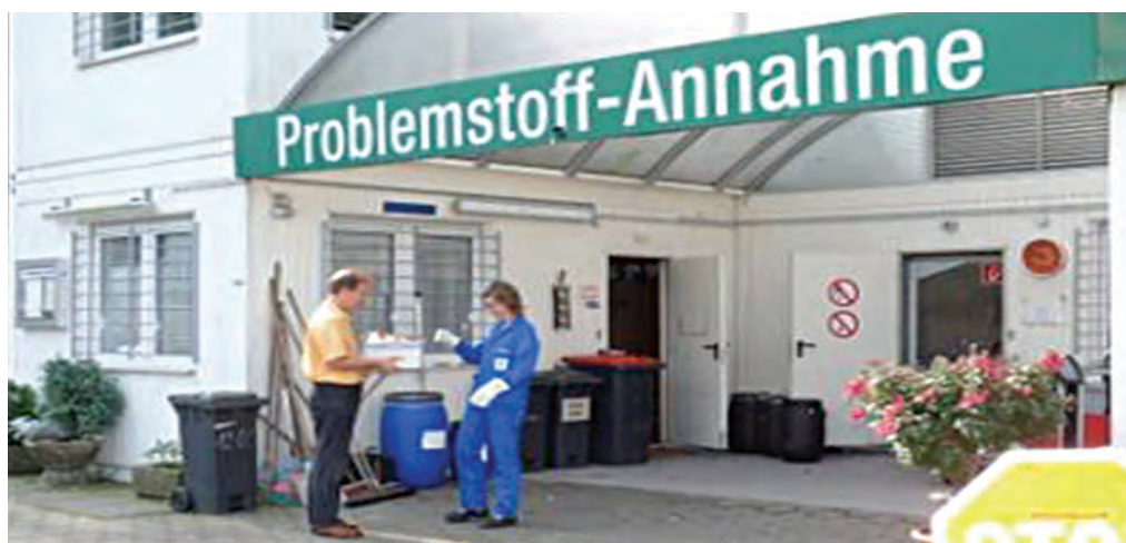
Figure 12 Collection of the hazardous waste at a recycling center

Как и в случае мобильного сбора опасных отходов, на пунктах приема вторичного сырья отходы принимает и документирует специально обученный квалифицированный персонал. Опасные отходы упаковываются в специальную упаковку и надежно закрепляются в автомобиле. Вывоз собранных отходов с пунктов осуществляется специально обученным водителем в соответствии с предписаниями Конвенции по транспортировке опасных грузов.